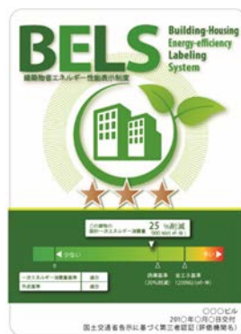
〔図1〕 ガイドラインに基づく第三者認証の例

また、ダイヤモンドリスponsに対応した時間帯別・季節別の電気料金メニューが選択できる場合はその活用にも努めるとともに、エネルギー管理システム（BEMS・HEMS等）の導入により、ビルの運用方法、住宅の住まい方の改善によるピーク対策及び省エネルギーに努めること。